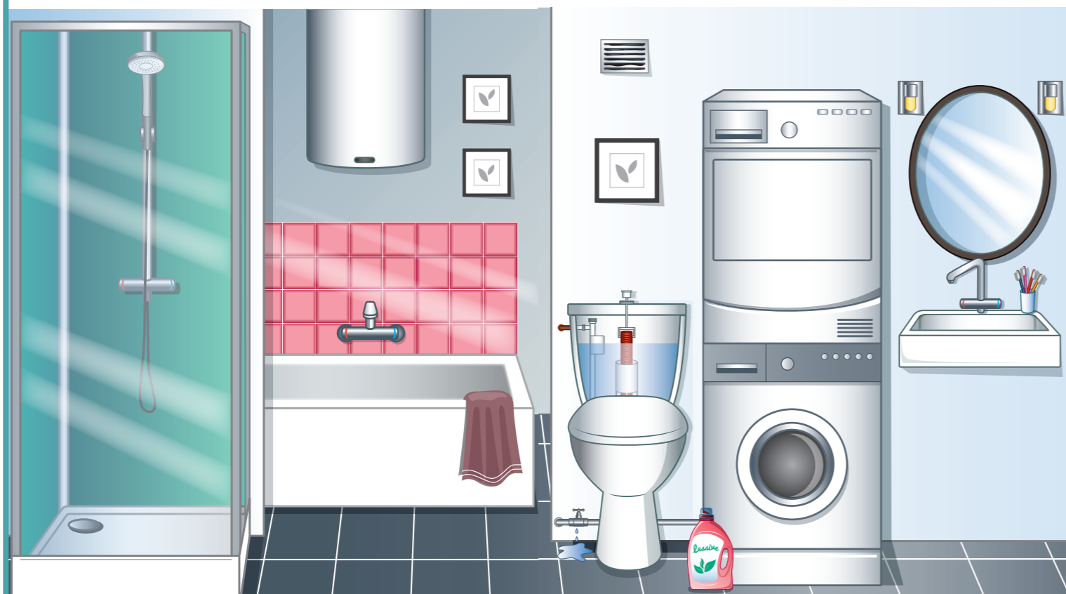
Illustration : Gayanée Beyréziat

Avec les participants, identifiez et entourez les différents endroits qui consomment de l'eau dans une salle de bain : la baignoire, la douche, le lave linge, le lavabo, les toilettes, la fuite d'eau. Ajoutez ceux qui n'auraient pas été entourés.